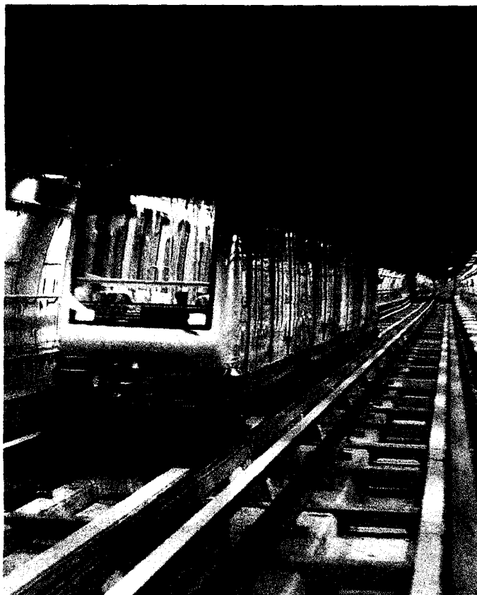
Un'immagine della linea 1 del metrò

A tempo di record, sindaco e assessori hanno raccolto il suggerimento e sostituito il lungo tunnel che doveva partire dalla Manifattura Tabacchi e poi, dopo essersi inabissato sotto il Po, arrivare a Barca Bertolla, con un prolungamento della Linea 2 del metrò il cui tracciato è pubblicato nel grafico qui sopra.