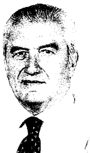
Franco Dessi sindaco di Rivoli

E a chi crede che l'attestamento di Collegno possa ba-