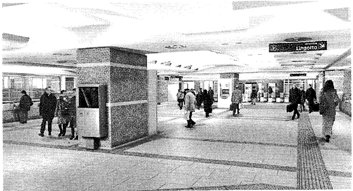
Ecco come si presenterà la fermata della metropolitana a Porta Nuova

Quello che si chiude questo pomeriggio è un capitolo importante. L'arrivo della fresa segna il completamento del primo tratto della «linea uno»: nove chilometri e 600 metri di galleria - dalla stazione Fermi (Collegno) a Porta Nuova - scavati sotto corso Francia impiegando tre diverse talpe: «Valentina», «Madama Cristina», «Valeria». Sembra trascorso un secolo: sono passati poco più di due anni. Da allora quella del metrò in formato subalpino si è già imposta all'attenzione dei torinesi come una delle pagine più significative del grande libro sulla trasformazione urbana. Anche per questo il clima sarà quello delle grandi occasioni. Domani il Gruppo Torinese Trasporti aprirà al pubblico il cantiere di piazza Carlo Felice (10-17,30). Pre-